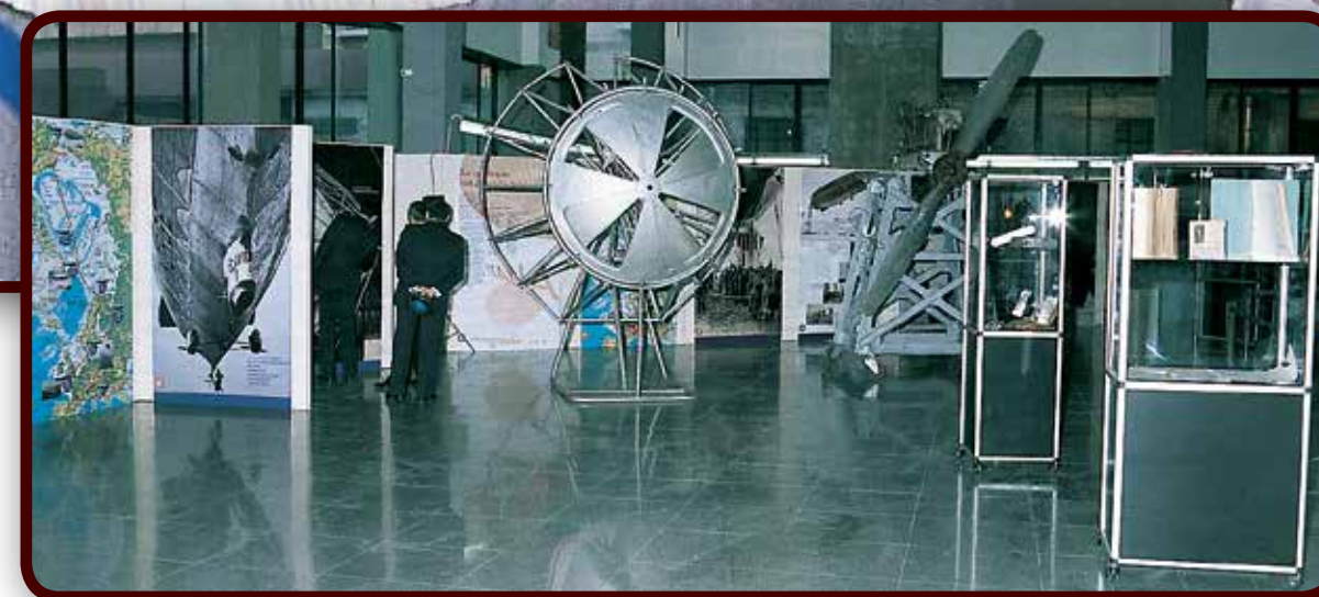
Immagini della prima edizione della mostra, svoltasi in occasione del 70° anniversario della spedizione del dirigibile Italia presso il Museo Nazionale della Scienza e della Tecnologia di Milano.